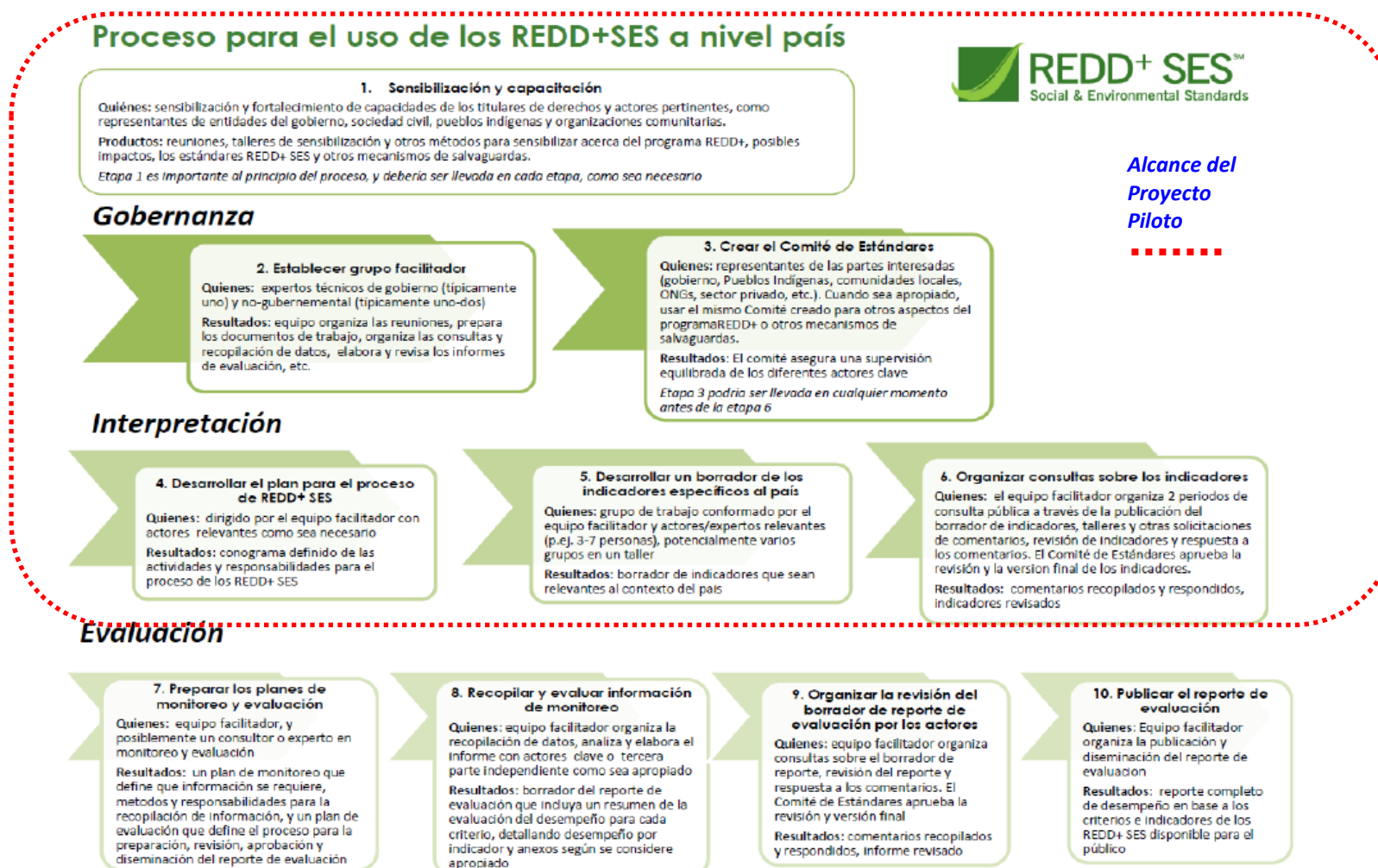
Apéndice 1. Diagrama de flujo de los diez pasos para aplicar los REDD+ SES a nivel nacional